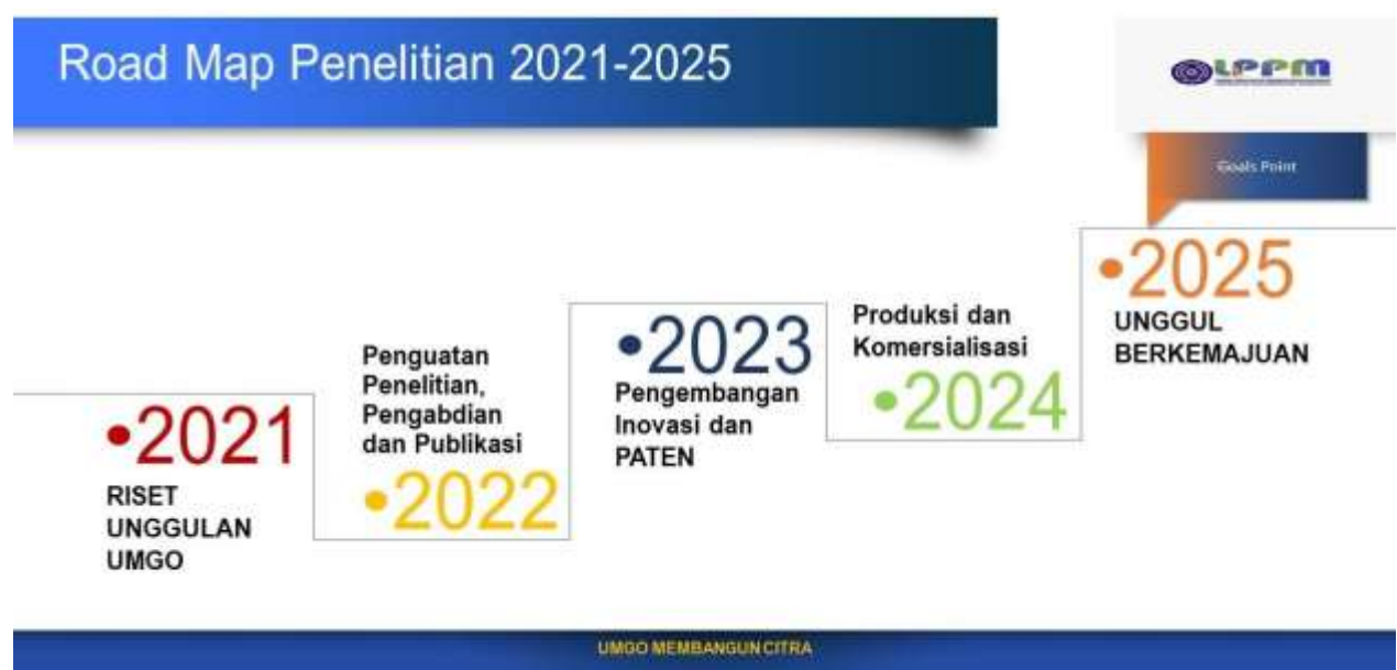
Gambar 1.1 Road Map Riset Unggulan UMGO

Peta Jalan Penelitian Unggulan Universitas Muhammadiyah Gorontalo disusun berdasarkan Kebijakan Renstra Universitas. Berbagai potensi dan kemampuan Universitas Muhammadiyah Gorontalo dalam berbagai lini terutama dalam pengembangan IPTEK dan Kemuhammadiyaaan, ditambah dengan kebijakan senat mengenai penelitian-penelitian unggulan UMGO, serta hasil evaluasi diri dan lain-lain seperti yang terlihat pada gambar berikut ini :