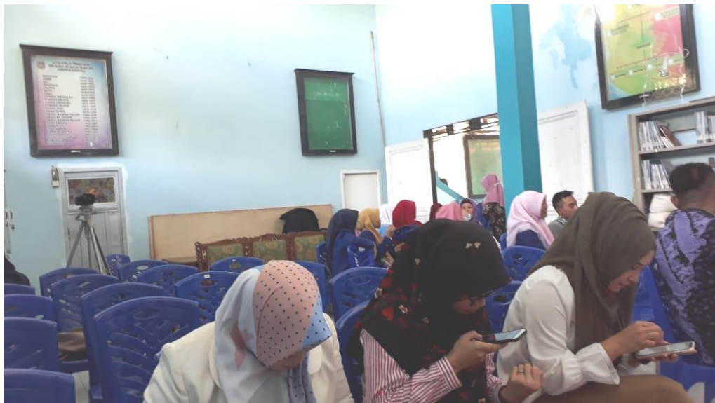
Gambar 1 Foto Peserta

Pemberian Materi ini dilaksanakan di desa Dumati Kecamatan Telaga Kabupaten Gorontalo, dengan peserta pelatihan yakni Masyarakat desa. Desa Dumati dan Aparat Desa sudah cukup memadai dari segi ruangan dan fasilitas kantor.