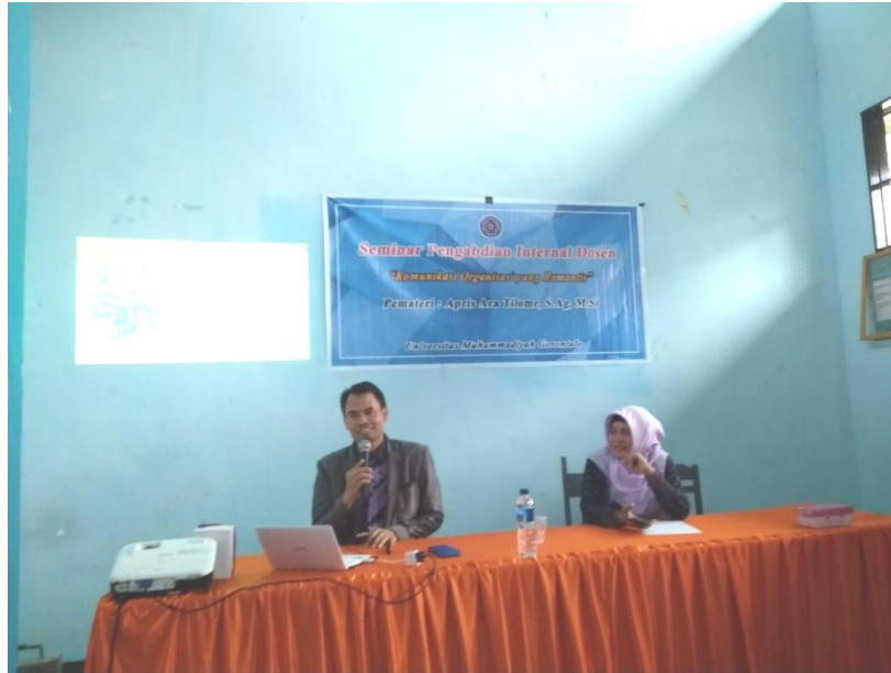
Gambar 2 Pemberian Materi