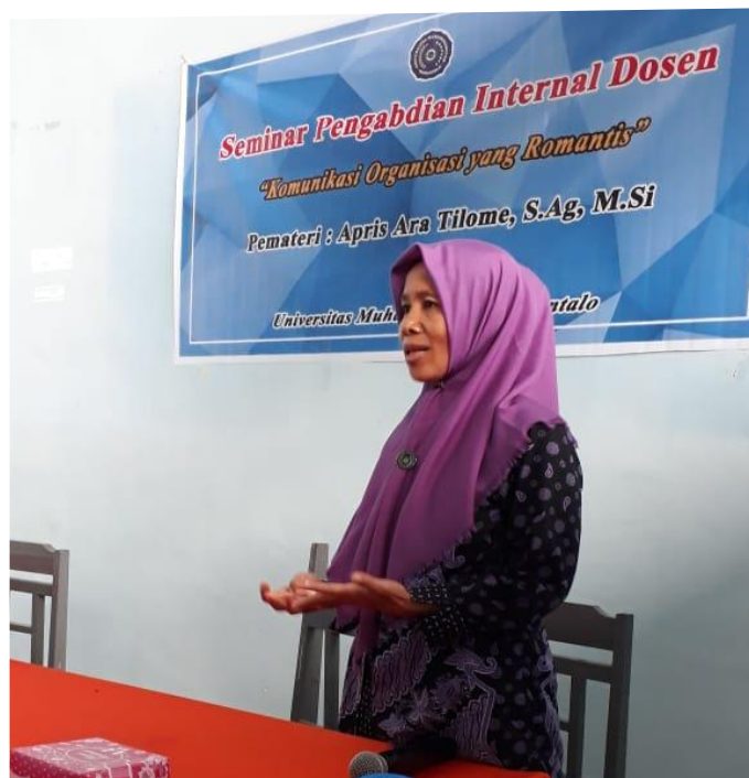
Gambar 3 Pemberian Materi